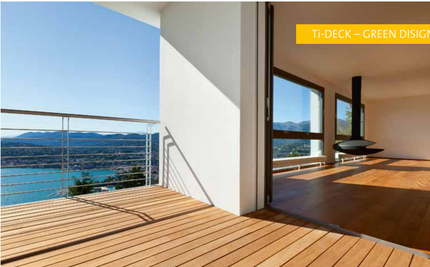
Ti-DECK Easy Step Calvados Ti-DECK Hard Step Mocco