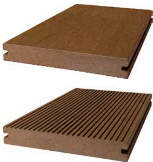
Террасная полнотелая доска Ti-Deck Hard Step Стандартная длина: 2,9 м