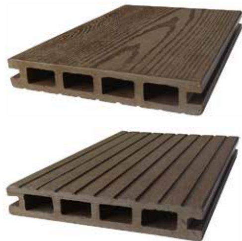
Террасная доска Ti-Deck Easy Step Стандартная длина: 2,9 м